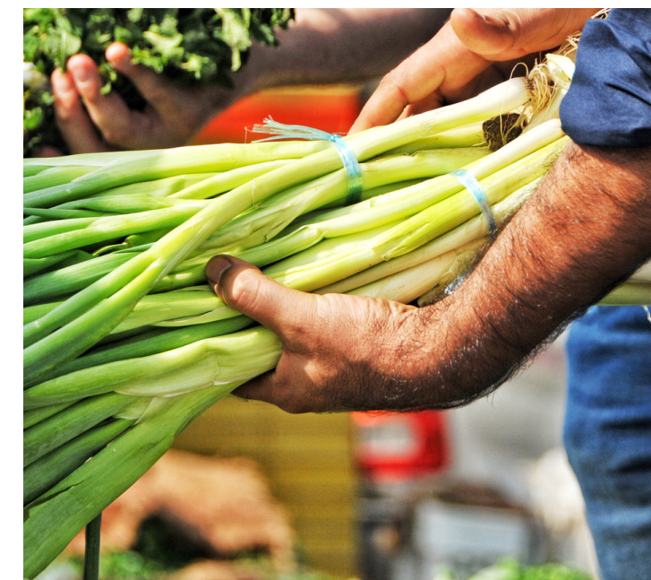
Prodotti che valorizzano la materia prima del territorio

Le domande che contengono l'acquisto di prodotti Dop e Igp e prodotti ad alto rischio spreco sono considerate prioritarie nell'assegnazione delle risorse